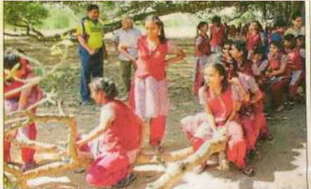
CHILDREN'S DAY OUT: Students got a free entry into Mysuru Zoo on Children's Day. (RIGHT) Students of Ranga Rao Memorial School for Differently-Abled, run by NR Group, play under the 400-year-old heritage Big Banyan Tree in Mysuru on Wednesday.