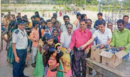
Children were offered biscuits on their visit to Mysuru Zoo and Dasara Exhibition.

MYSURU: A variety of events marked Children's Day in the city on Wednesday. Schools had organised a variety of events on the day. Children performed cultural activities and sweets were distributed among children. Children thronged Sri Chamarajendra Zoological Gardens in Mysuru, to spend the day amid the birds and animals. They were allowed free entry to the Zoo on Wednesday,