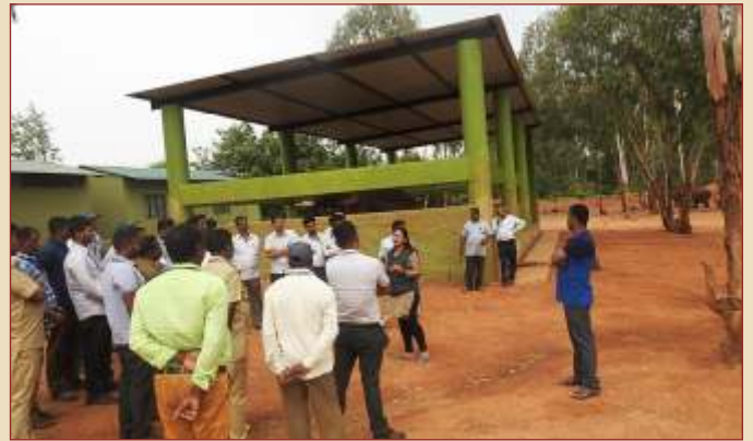
Visit to Kurgahalli Rescue Center