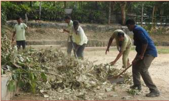
Cleaning of Enclosure