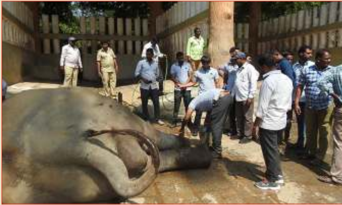
Foot Care Management